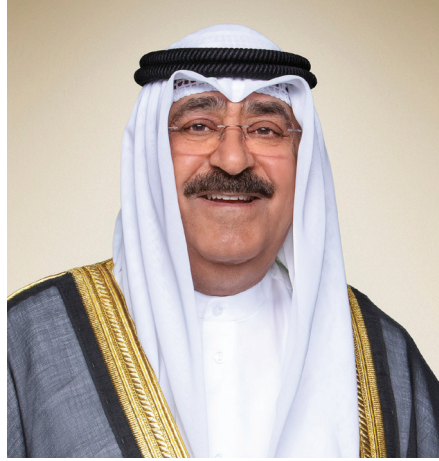
سمو الشيخ/ مشعل الأحمد الجابر الصباح ولي عهد دولة الكويت