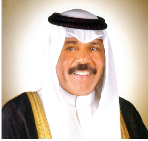
صاحب السمو الشيخ/ نواف الأحمد الجابر الصباح أمير دولة الكويت