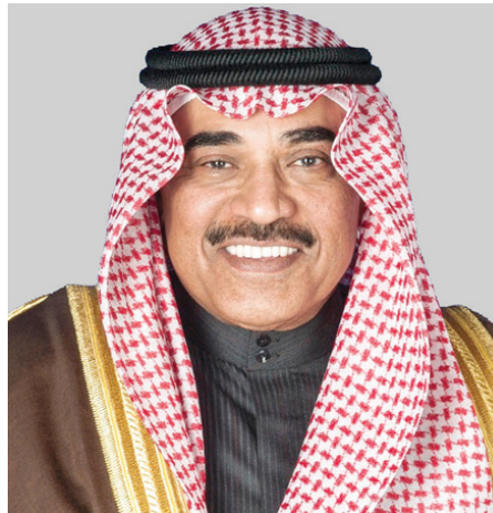
الشيخ/ صباح خالد الحمد الصباح رئيس مجلس وزراء دولة الكويت