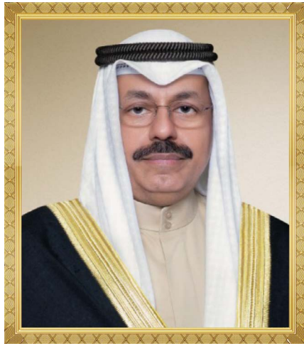
الشيخ/ أحمد النواف الأحمد الصباح رئيس مجلس وزراء دولة الكويت