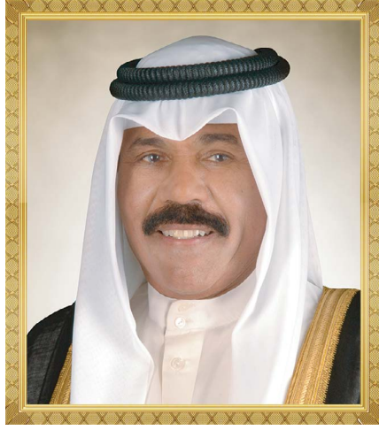
صاحب السمو الشيخ/ نواف الأحمد الجابر الصباح أمير دولة الكويت