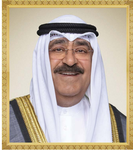
سمو الشيخ/ مشعل الأحمد الجابر الصباح ولي عهد دولة الكويت